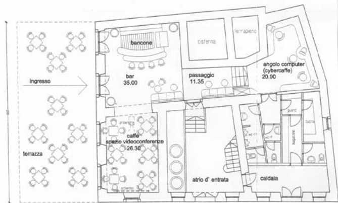
PROGETTO INIZIALE; APPROVATO DALL'ASSEMBLEA DELL'UNIONE ITALIANA

degli enti citati e potranno essere finanziati nell'ambito dell'iniziativa Interreg III A Italia – Slovenia , Asse 2 "Cooperazione economica", Misura 2.2 "Cooperazione transfrontaliera nel settore del turismo", Azione 2.2.1 "Promozione del turismo nell'area transfrontaliera", di cui è portatrice per l'area litoranea della Slovenia la CAN costiera.